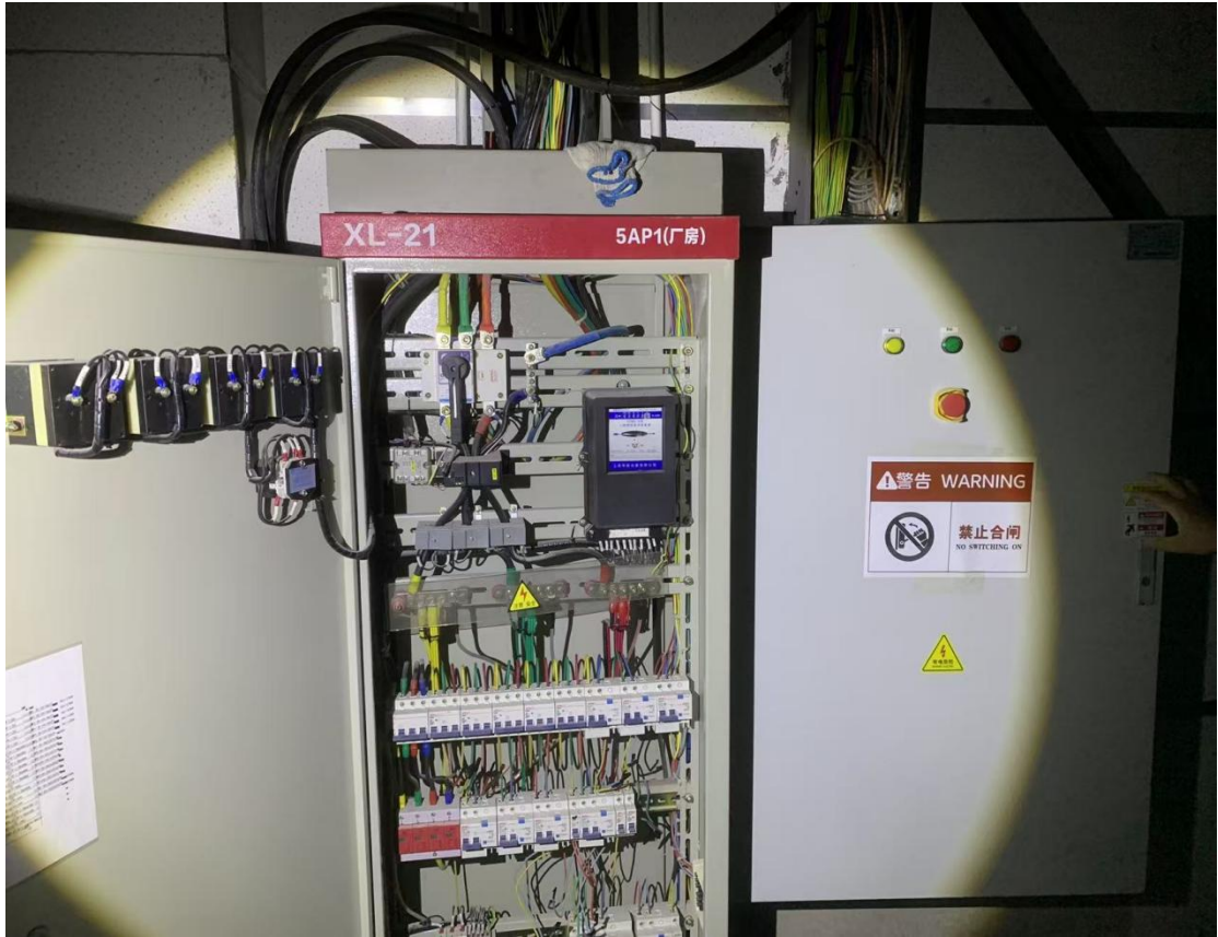
(6) 事发空调线路分支配电箱 (5AL1-2)