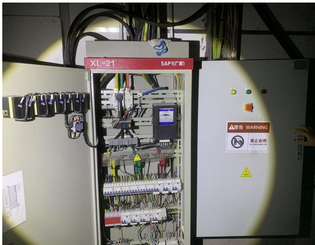
(6) 事发空调线路分支配电箱 (5AL1-2)