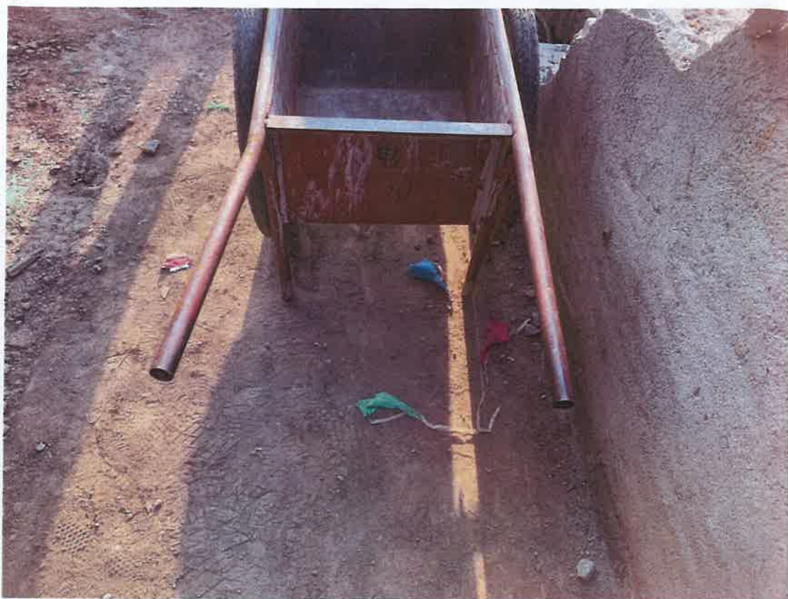
(7) 垃圾池与手推车碰撞痕迹情况